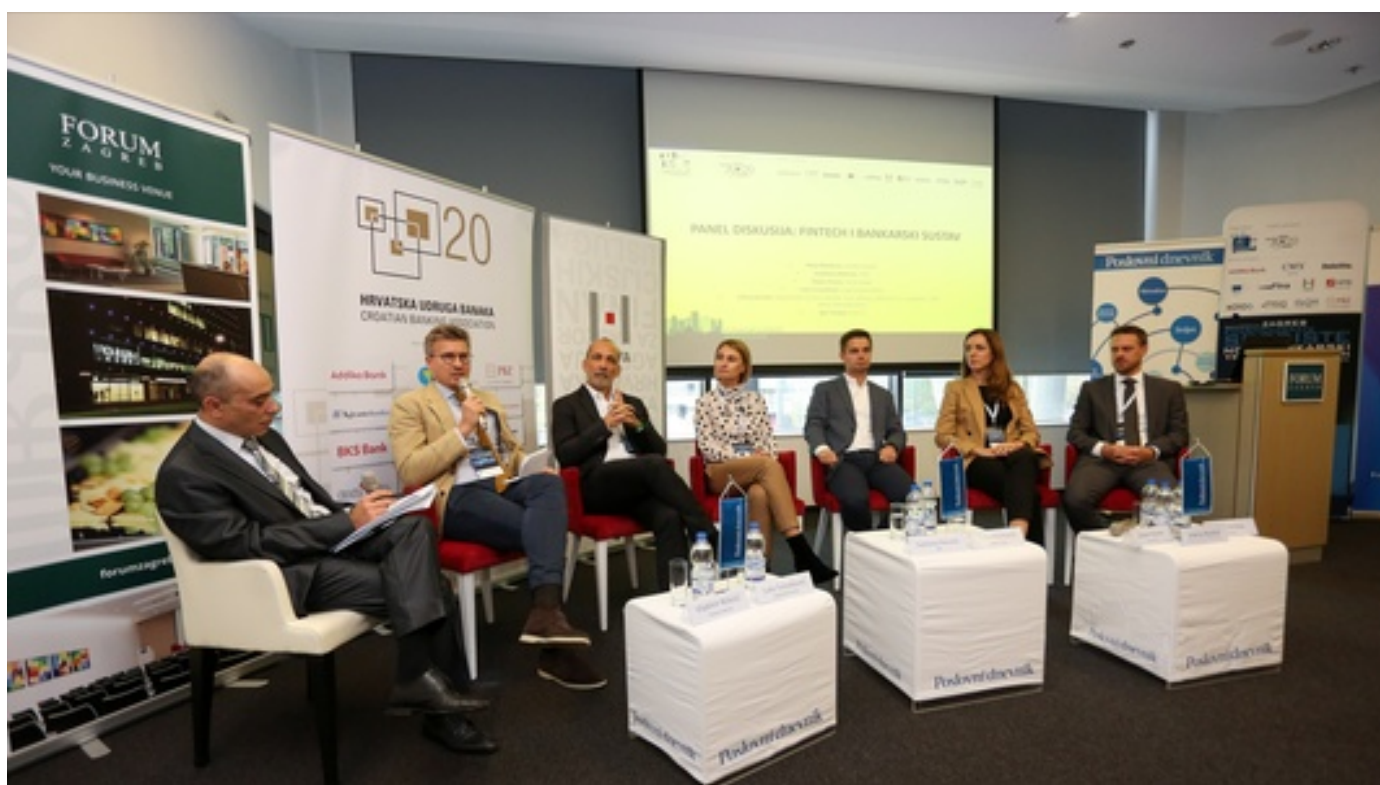
Konferencija: Zagreb financijsko središte