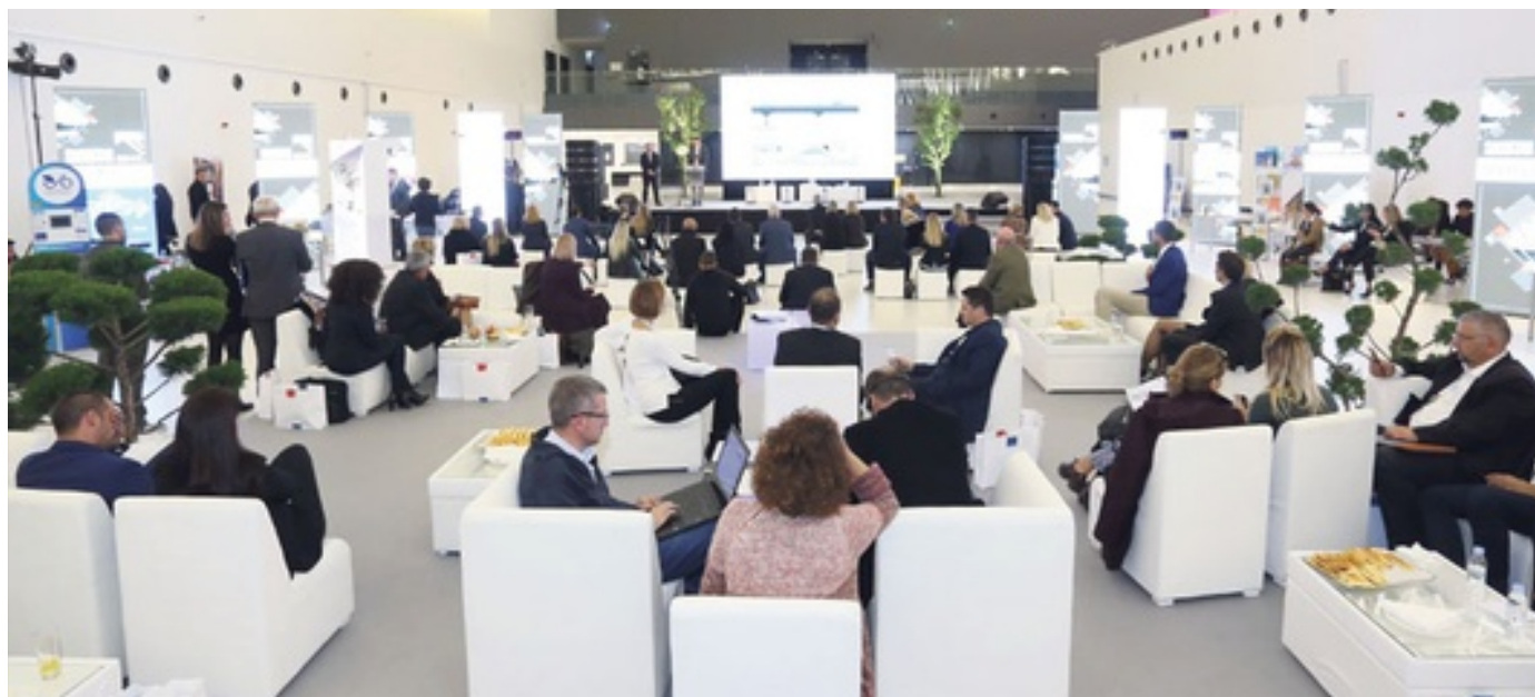
Detaljan pregled svih poslovnih konferencija