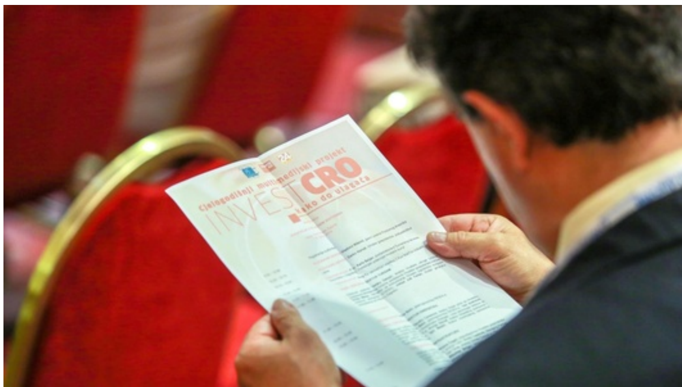
Konferencija: InvestCro: Kako do ulagača?