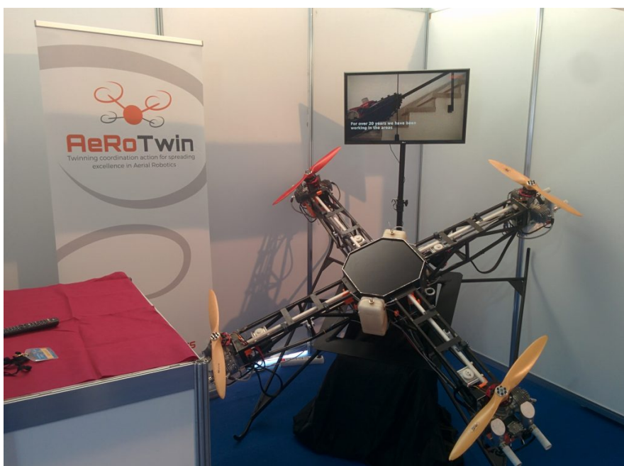
Rijeka Nautic Show – predstavljeni projekti MORUS i AeRoTwin

Posjedujete li dron? Ili možda poznajete nekoga tko posjeduje dron? Sigurni smo da je na jedno od ovih pitanja odgovor potvrđan jer dronovi otkad su se pojavili osvajaju tržište. To znaju i FER-ovci i zbog toga organiziraju prvi skup o dronovima – DroneDays.